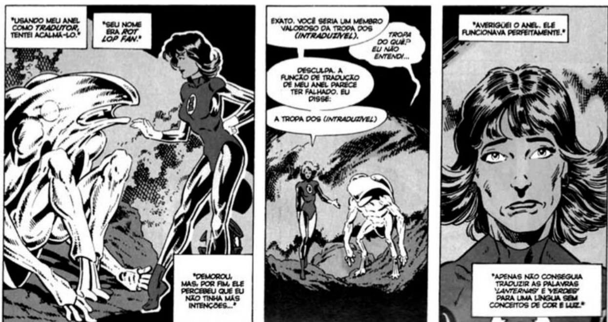
Lanterna Verde Katma Tui - Quadrinhos na Educação, p.85