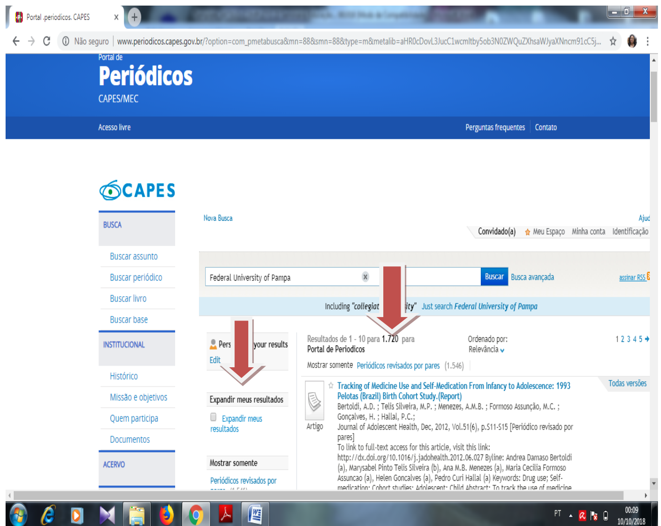
Figura 1 – Pesquisa com termo.

de expandir os resultados e dessa forma ampliar o número de trabalhos recuperados passando após optar clicando em expandir resultados para 2285 trabalhos. Para restringir e direcionar a pesquisa significativamente, pode-se optar pela busca avançada, onde é possível fazer uma combinação mais apurada, como o exemplo ilustrado na Figura 2.