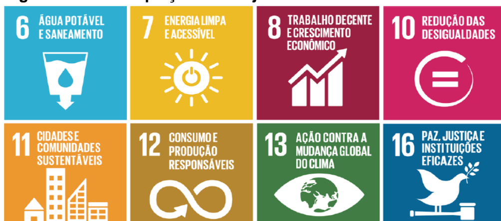
Figura 02: Contemplação dos objetivos do desenvolvimento sustentável.