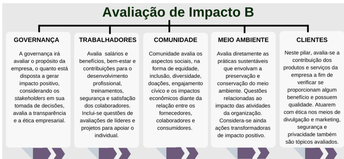
Figura 01: Pilares da Avaliação de Impacto B.