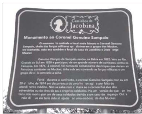
Figura 8: Placa Indicativa dos Caminhos de Jacobina

Temos ainda, como parte importante dos Caminhos de Jacobina , o lugar conhecido como Colônia de Jacobina , sendo esse um dos pontos turísticos mais explorados do roteiro. O lugar, que serviu de cenário para as filmagens do filme A Paixão de Jacobina , está situado no alto do morro Ferrabraz, na localidade de Picada Schneider, zona rural de Sapiranga, e apresenta aos visitantes o cenário construído pela equipe de filmagens para a produção de A Paixão de Jacobina .