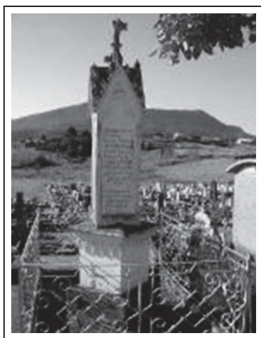
Figura 1: Túmulo do Cemitério de Amaral Ribeiro

A sepultura , construída em 1874, foi a primeira representação monumental construída pela comunidade da Colônia Alemã para homenagear aqueles que haviam dado sua vida no combate aos Mucker. Esse monumento, localizado no cemitério do Amaral Ribeiro, em Sapiranga, procurou enaltecer a ação dos colonos mortos em combate, ao mesmo tempo que apontou os Mucker como seus assassinos. Na lápide da sepultura, encontramos uma homenagem, escrita em alemão, prestada aos homens que morreram em virtude dos supostos ataques dos Mucker e assinada pelos moradores da colônia. Como contraponto disso, temos o fato de Jacobina, juntamente com dezenas de Mucker assassinados, terem sido enterrados em uma vala comum nas proximidades do local onde ficava a residência de Jacobina e onde seria, décadas mais tarde, erguido o monumento em homenagem ao coronel Genuíno.