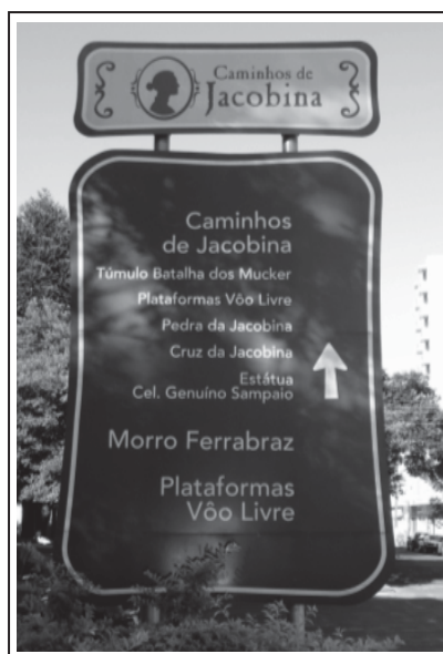
Figura 6: Placa indicativa dos Caminhos de Jacobina

O museu consiste em lugar de referência para os visitantes que buscam conhecer a cultura e as tradições herdadas dos imigrantes alemães, contando com significativo acervo bibliográfico 15 sobre os Mucker. O museu, no entanto, não possui nenhum outro acervo associado aos Mucker, o que causa, muitas vezes, surpresa aos visitantes 16 .