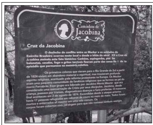
Figura 7: Placa Indicativa dos Caminhos de Jacobina

Chama a atenção que, ao lado da cruz de Jacobina - local que simboliza o lugar em que ela foi assassinada em 1874 -, também encontramos uma placa que apresenta aos visitantes um breve resumo sobre o conflito e enfatiza o papel assumido por Jacobina na história do conflito.