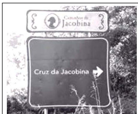
Figura 5: Placa Indicativa dos Caminhos de Jacobina

Outro aspecto que nos chama a atenção em nosso estudo é o logotipo criado para identificar e divulgar para os visitantes os Caminhos de Jacobina . Esse tem como imagem o busto de Jacobina vista de perfil, ao qual é justaposto o título Caminhos de Jacobina. Chama-nos a atenção a evidência dada à líder dos Mucker. Sua imagem estilizada é empregada simbolicamente para fomentar o turismo da região, e seu nome é transformado em ícone para atrair a atenção dos visitantes.