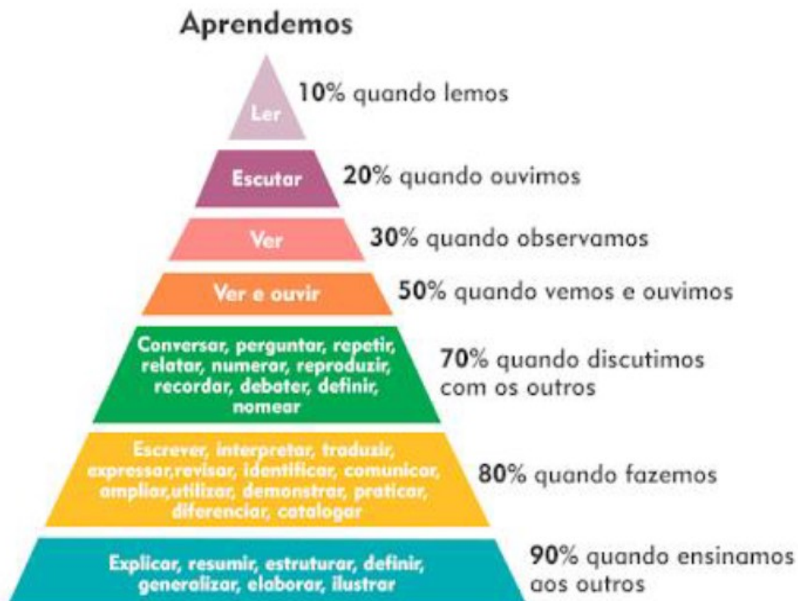
Figura 3- Pirâmide de Aprendizagem de William Glasser