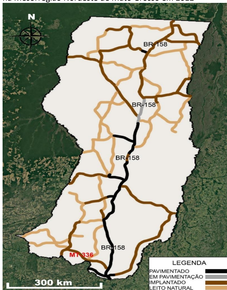
Figura 4: Mapa ilustrativo da malha rodoviária estadual e federal na Mesorregião Nordeste de Mato Grosso em 2012