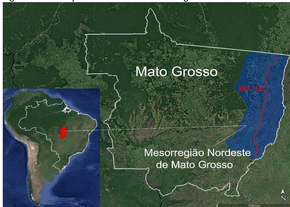
Figura 1: Localização da BR-158 e da Mesorregião Nordeste de Mato Grosso