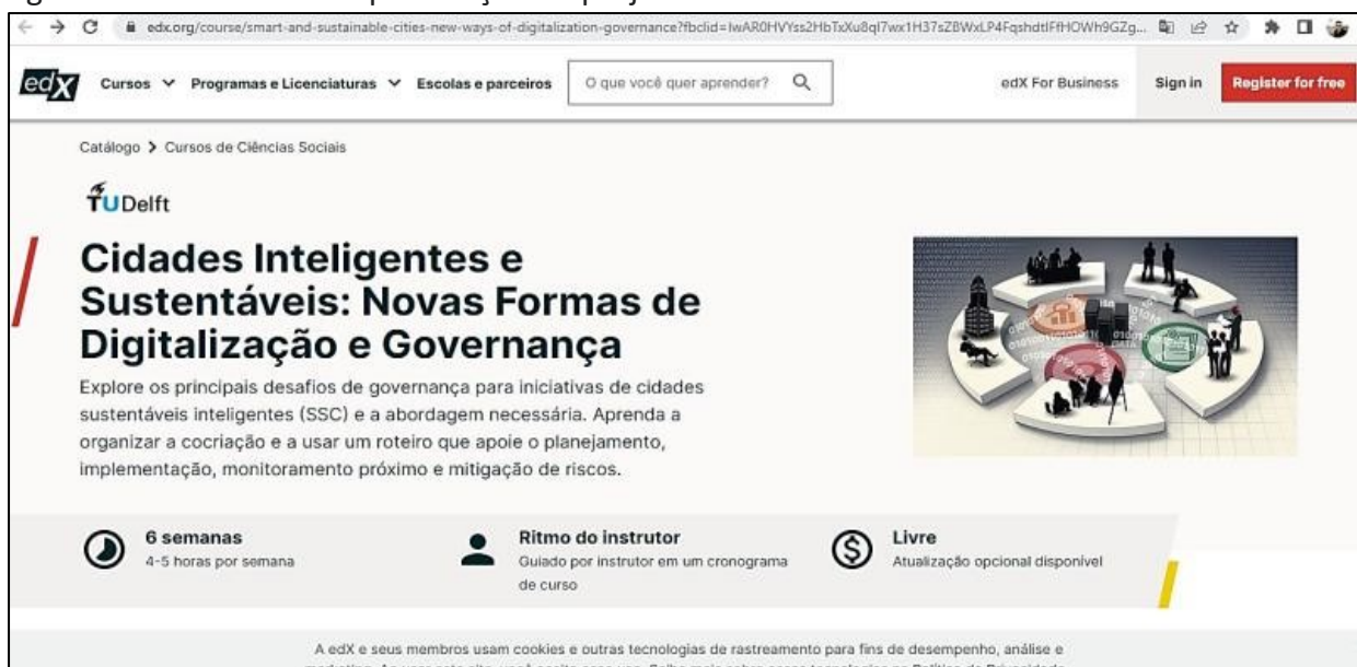
Figura 6 – Plataforma de qualificação do projeto