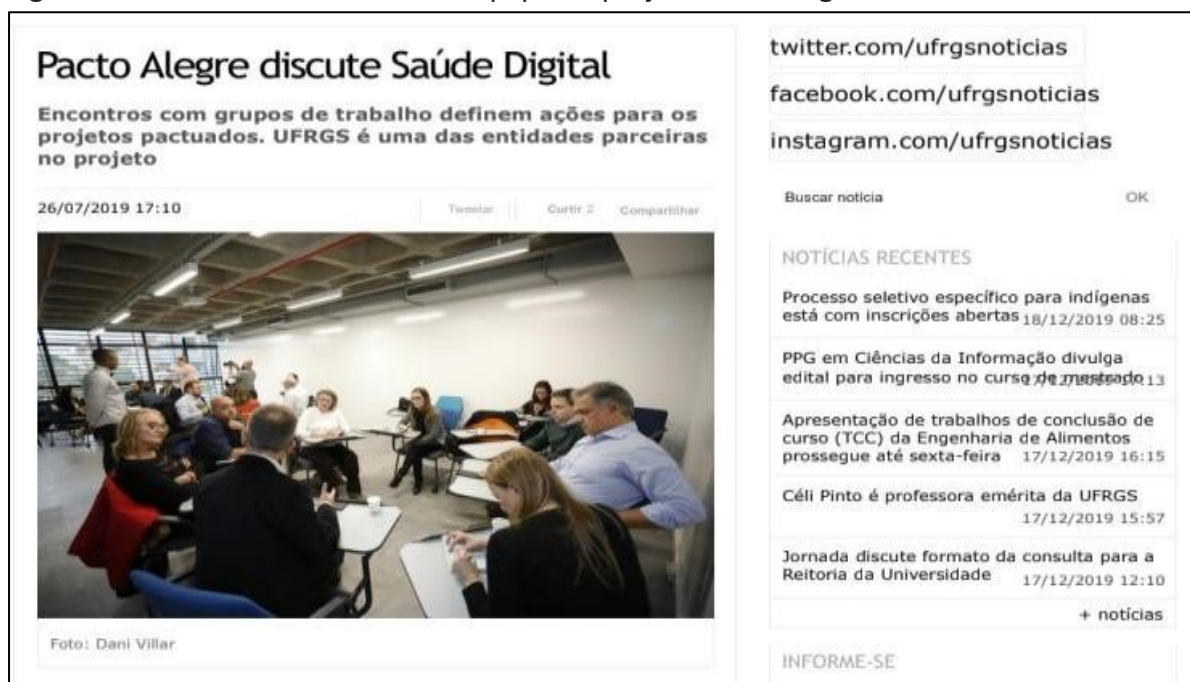
Figura 5 – Encontro de trabalho da equipe do projeto Saúde Digital

Reforçar a parceria global para o desenvolvimento sustentável, complementada por parcerias multissetoriais que mobilizem e compartilhem conhecimento, expertise, tecnologia e recursos financeiros, para apoiar a realização dos objetivos do desenvolvimento sustentável em todos os países, particularmente nos países em desenvolvimento. (ONU – BRASIL, 2022).