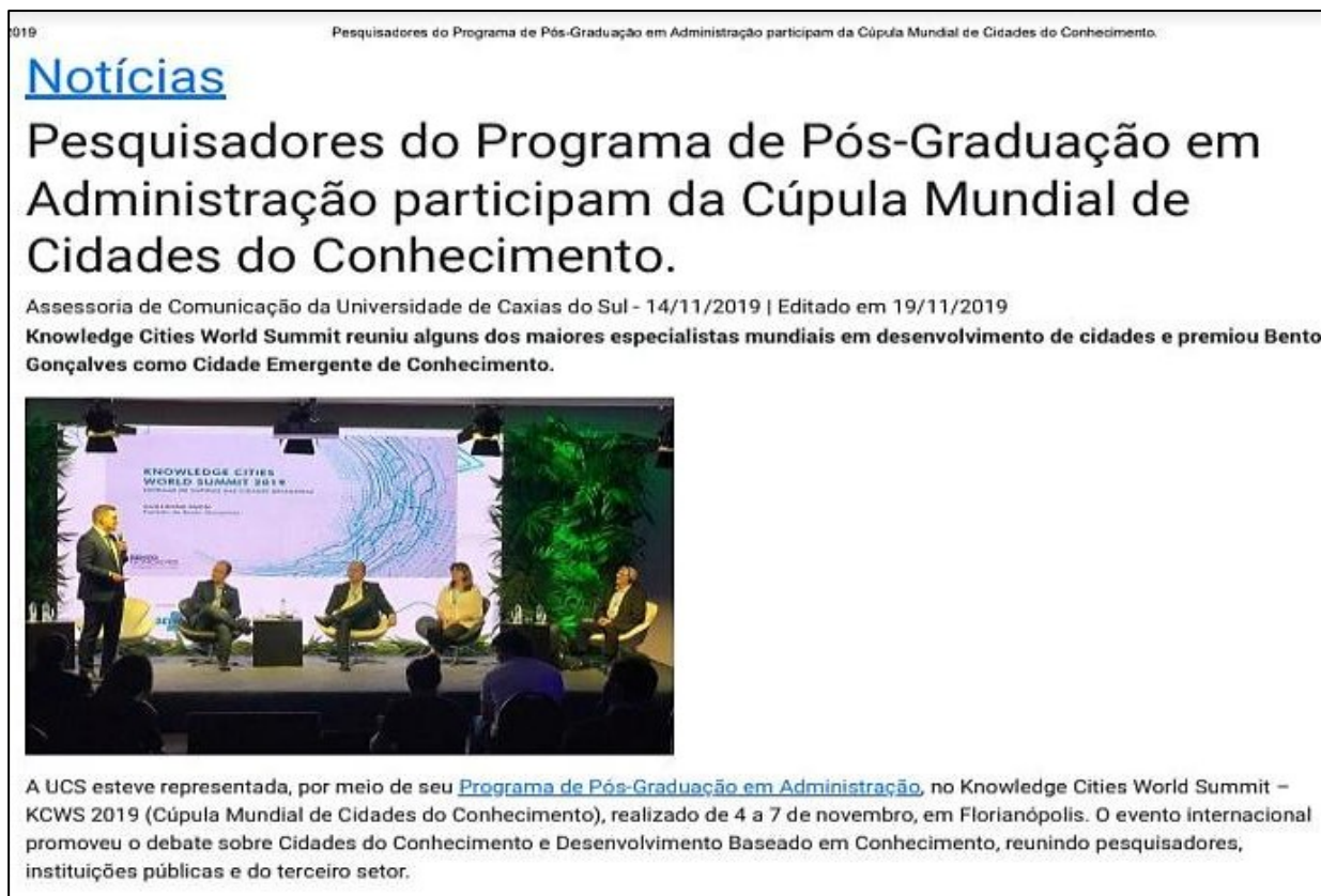
Figura 4 – Divulgação do projeto e discussão na Cúpula Mundial de Cidades do Conhecimento no ano de 2019.

Analisando o ODS 3 itens 3.8 que diz: “Atingir a cobertura universal de saúde, incluindo a proteção do risco financeiro, o acesso a serviços de saúde essenciais de qualidade e o acesso a medicamentos e vacinas essenciais seguros, eficazes, de qualidade e a preços acessíveis para todos” (ONU – BRASIL, 2022), o entrevistado E12 relata que o projeto “poderá possibilitar o bem-estar do cidadão”. A figura 4 mostra a divulgação do projeto.