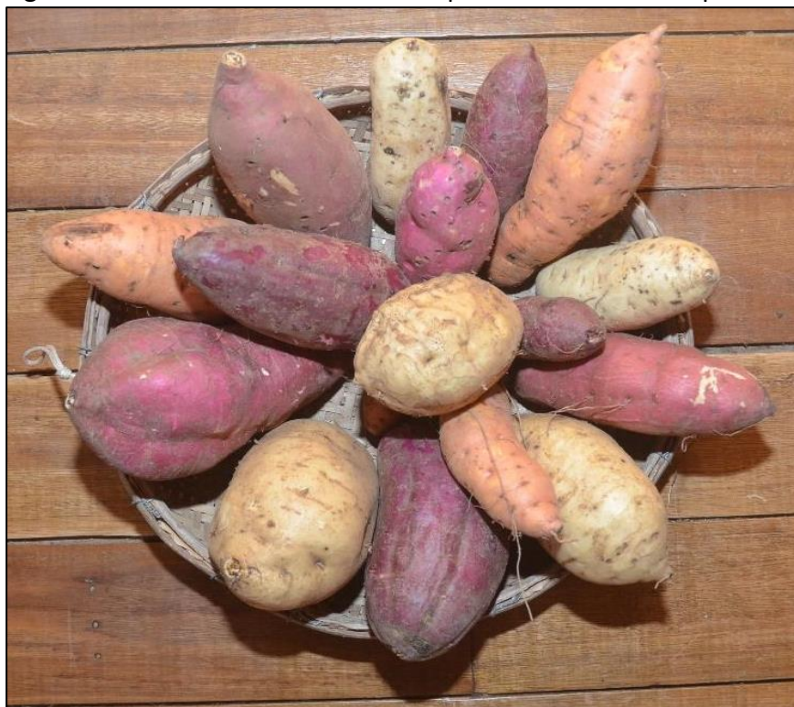
Figura 1 - Variedades de batata-doce produzidas no município de Mariana Pimentel (RS)

Por exemplo, algumas batatas-doces possuem maior teor de umidade, popularmente são chamadas de “aguadas” e, quando cozidas, acabam sendo menos apreciadas. São, portanto, mais indicadas para o preparo de batata-doce assada. O inverso também ocorre: a batata-doce com menor teor de umidade, quando assadas, podem se tornar muito secas. Os teores de umidade das batatas-doces da mesma cor podem ser muito distintos, impactando na qualidade do alimento preparado.