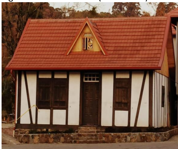
Figura 4. Primeira Sede (1903-1933).