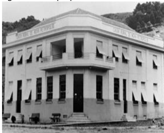
Figura 7. Sede própria.