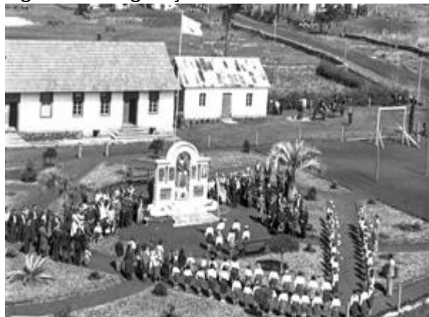
Figura 9. Inauguração do monumento.