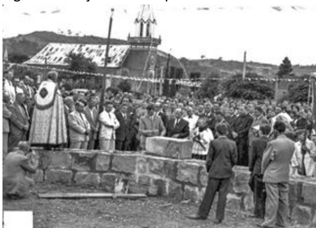
Figura 6. Lançamento da pedra da sede.

Em 1933, a Cooperativa foi transferida para a casa do então gerente José Otto Neumann na vila de Linha Imperial (Figura 5). Em 1952 com a presença do Governador do Estado, General Ernesto Dornelles, foi colocada a pedra angular do prédio (Figura 6), em evento solene contando com mais de 1.500 pessoas no ato, onde também foi comemorado os 50 anos de fundação. No ano de 1953, a sede foi transferida para o primeiro prédio novo, localizado ao lado da Praça Padre Amstad (Figura 7). Em 1958 é criada a filial, no centro de Nova Petrópolis.