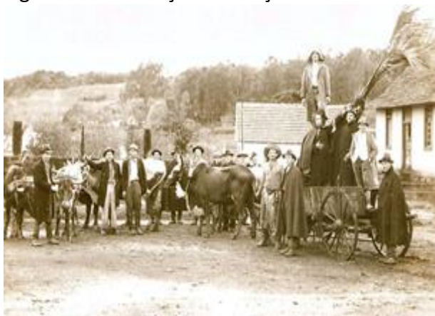
Figura 8. Construção da Praça.