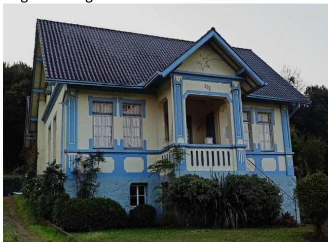
Figura 5. Segunda Sede.