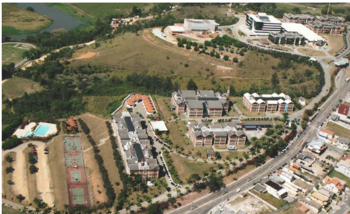
Figura 3. Campus Urbanova da Universidade do Vale do Paraíba (Univap).

A valorização dos terrenos no bairro Urbanova tem sugerido como causa a construção do campus universitário da Univap a partir de 1990. Ainda não há um estudo que avalie a taxa de crescimento do preço da terra no Urbanova; no entanto, alguns moradores disseram em seus depoimentos ter comprado o terreno por dez mil, ou trocado por carro e moto, na década de 1990, e que agora os terrenos podem ser vendidos por R$ 270 mil e até R$ 1.070.000 milhão (HORIZONTE, 2018), demonstrando que houve uma rápida valorização nos últimos 20 anos e que a maioria dos que compraram o terreno naquela época não esperavam que, no futuro, morariam em um dos bairros mais valorizados da cidade.