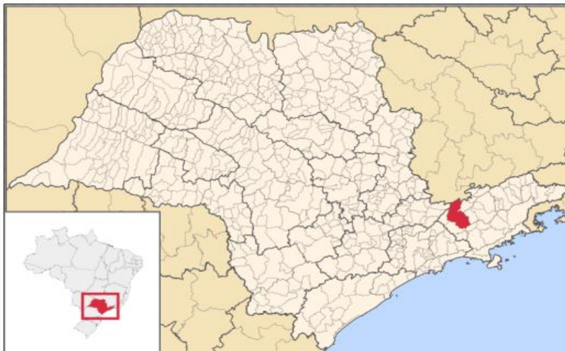
Figura 1. Município de São José dos Campos localizado no Estado de São Paulo.