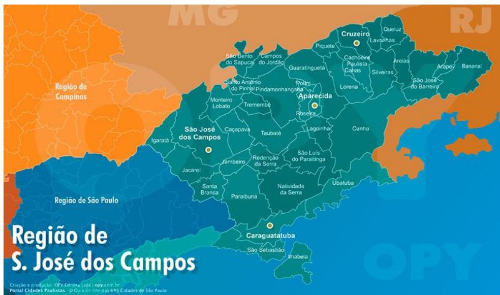
Figura 2. Mapa da região administrativa de São José dos Campos