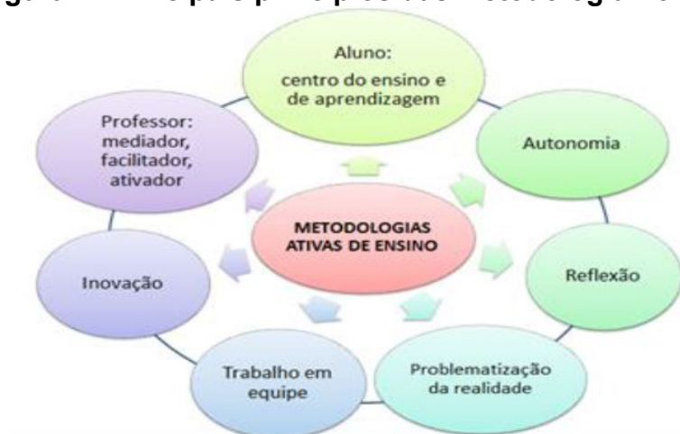
Figura 1: Principais princípios das Metodologia Ativas