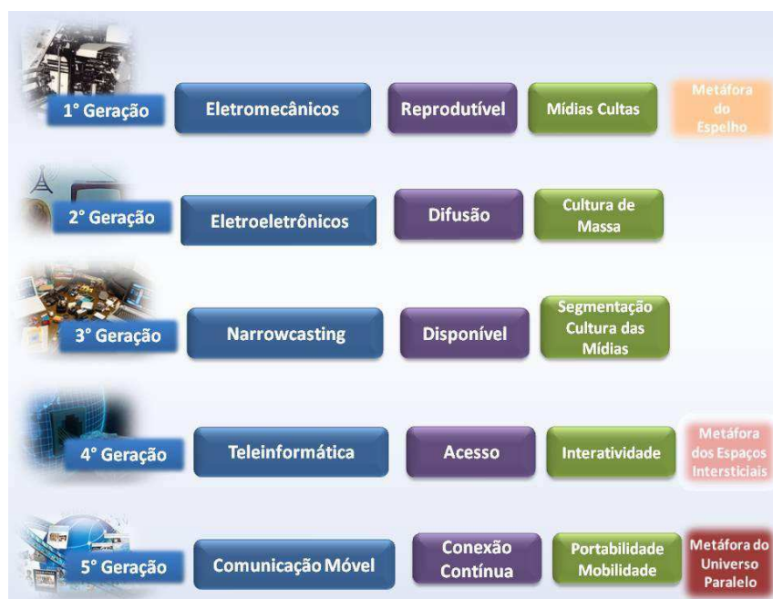
Figura nº 1

Santaella (2007) divide o tempo cronológico comunicacional da seguinte forma: