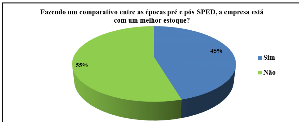
Gráfico 01 – Comparativo controle estoque pré / pós-SPED

No questionário realizado, foi perguntado se, comparando as épocas pré e pós-SPED, houve uma melhora no controle de estoque e, dentre os onze entrevistados, a proporção ficou a seguinte, demonstrada no gráfico 01: